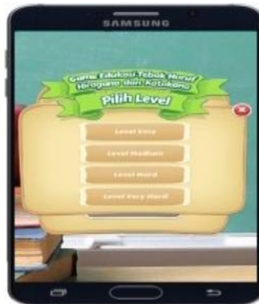
Gambar 6. Form Konfirmasi Pilihan Bermain.

Adapun tampilan form konfirmasi pilihan bermain. sebagai berikut :