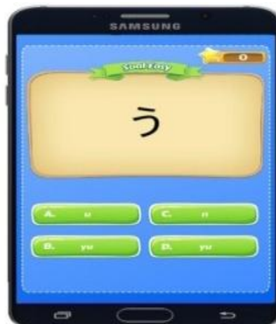
Gambar 7. Form Bermain Soal Easy.

Pada form bermain soal easy ini terdapat 4 pilihan berganda untuk menjawab soal level easy yang muncul.