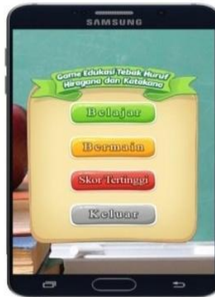
Gambar 2. Form Menu Utama.