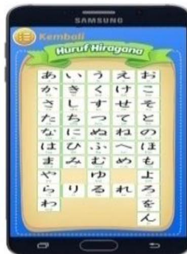
Gambar 4. Form Belajar Hiragana .

Pada form belajar Hiragana ini terdapat materi huruf-huruf Hiragana yang akan di gunakan user untuk belajar dengan membaca kemudian menghafal huruf-huruf tersebut untuk menjawab soal-soal permainan.