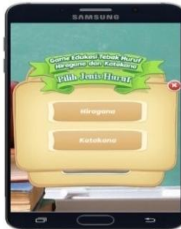
Gambar 3. Form Konfirmasi Pilihan Belajar

Terdapat 2 pilihan pada form ini, yaitu menu Hiragana untuk menampilkan form belajar Hiragana dan menu Katakana untuk menampilkan form belajar Katakana .