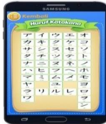
Gambar 5. Form Belajar Katakana

Form Ini tampil setelah user memilih menu Katakana pada form konfirmasi pilihan belajar.